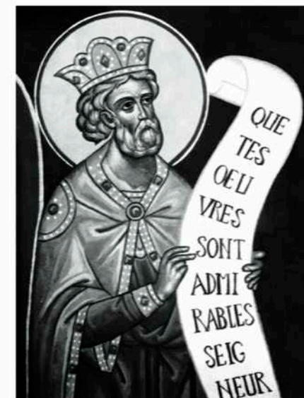
Le Roi et Prophète David - détail de fresque du Monastère Orthodoxe Saint Antoine le Grand (Dauphiné)

Apprendre à chanter dans la tradition millénaire du chant byzantin