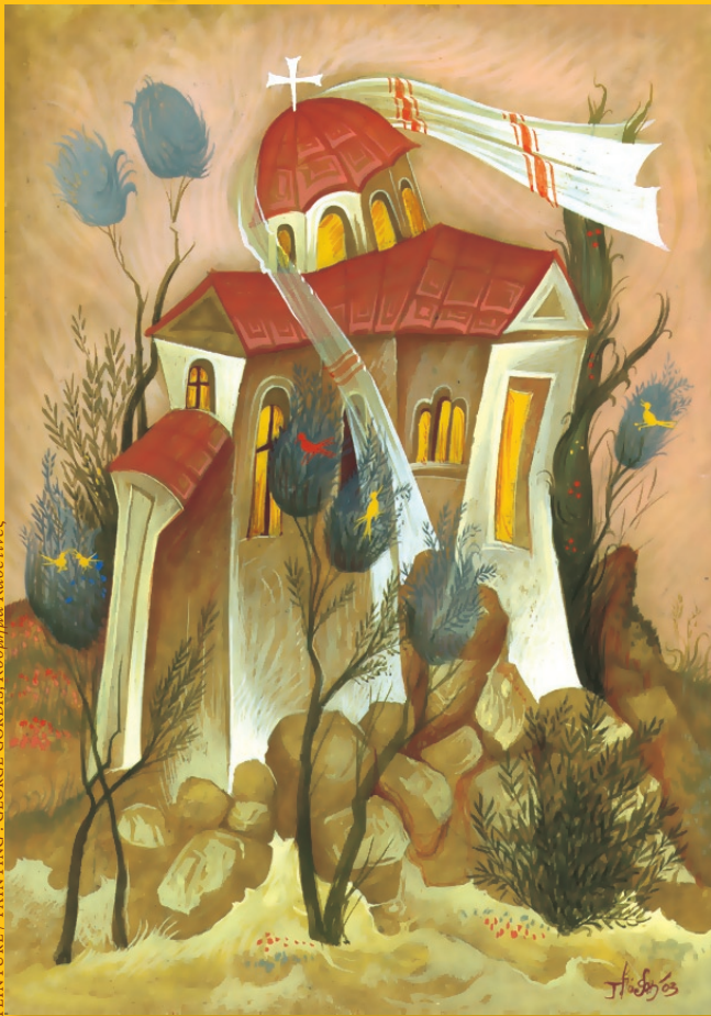
PEINTURE / PAINTING : GEORGE GORDIS, Κορυμια Καετηνec