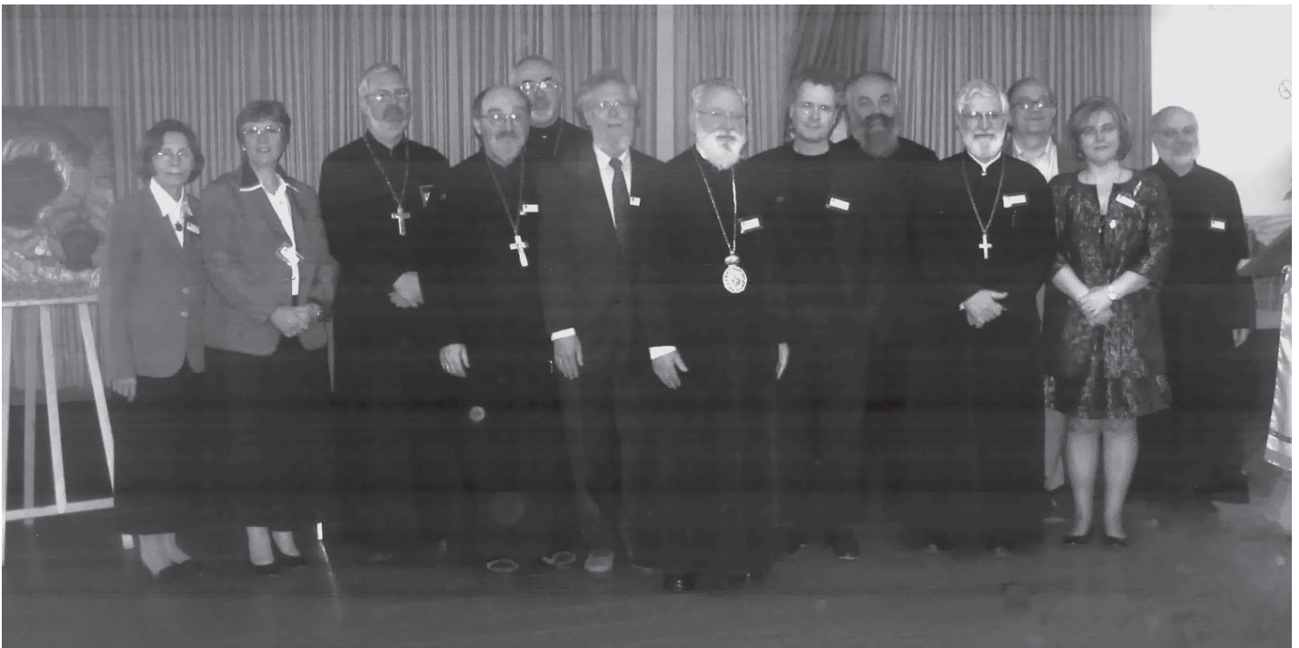
Conférenciers et organisateurs du Colloque 2010 / Speakers and organizers of the Colloquium 2010